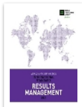
МС по образованию