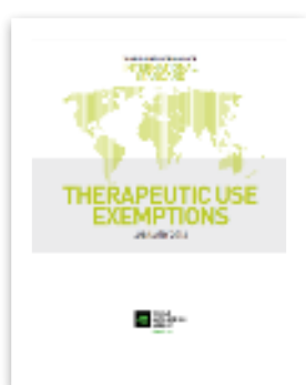
МС по терапевтическому использованию