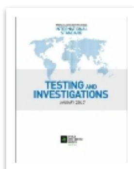
МС по тестированию и расследованиям