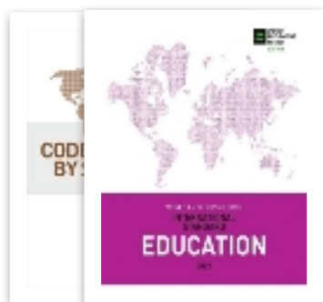
МС по соответствию сторон