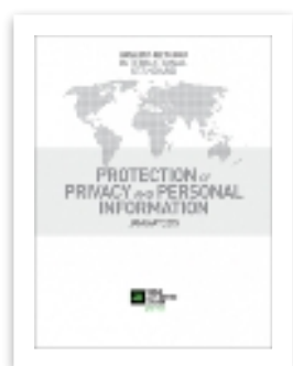
МС по сохранению конфиденциальности информации о частных лицах